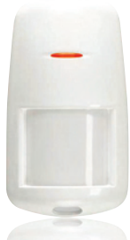
Motion Sensor MS845 Art.nr. 09758