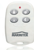
Keyfob remote KR814 Art.nr. 09755