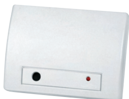
Glassbreak Sensor GB843 Art.nr. 09766