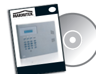
6x Installation manual on CD 3x Quick installation guide 3x User manual English, Français, Nederlands or Deutsch, Español, Italiano