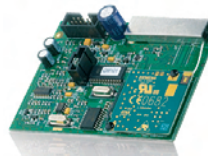
X10 Home Automation module PG800 Art.nr. 09886