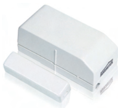
Door Window Sensor DS831 Art.nr. 09759