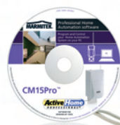
X10 ActiveHomePro incl. CM15Pro Art.nr. EU: 09793 UK: 09800

For all other Marmitek X-10 modules see: www.marmitek.com