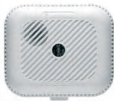
Smoke Detector SD833 Art.nr. 09760