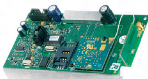
GSM Module GSM800 Art.nr. 09753