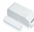
1x Door/window sensor DS831