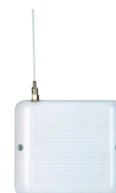
Wireless Repeater RP835 Art.nr. 09764