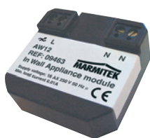
X10 In Wall Appliance module AW12 Art.nr. 09463