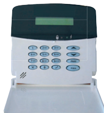
Hardwire LCD Keypad HK855 Art.nr. 09769