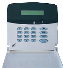
Hardwire LCD Programming Keypad PK836 Art.nr. 09770