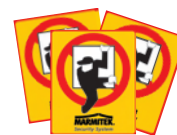
3x Burglary prevention Sticker