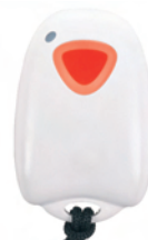
Panic Remote PR811 Art.nr. 09754