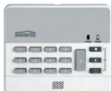
Wireless Keypad WK820 Art.nr. 09756