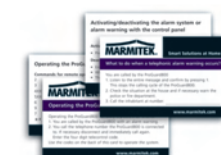
3x User guidance cards English, Français, Nederlands or Deutsch, Español, Italiano