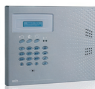
1x Home Control Panel with voice module and backup Lithium Accu